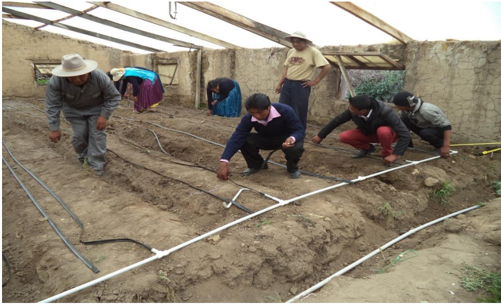
Implementación del sistema de riego por goteo en marzo de 2015