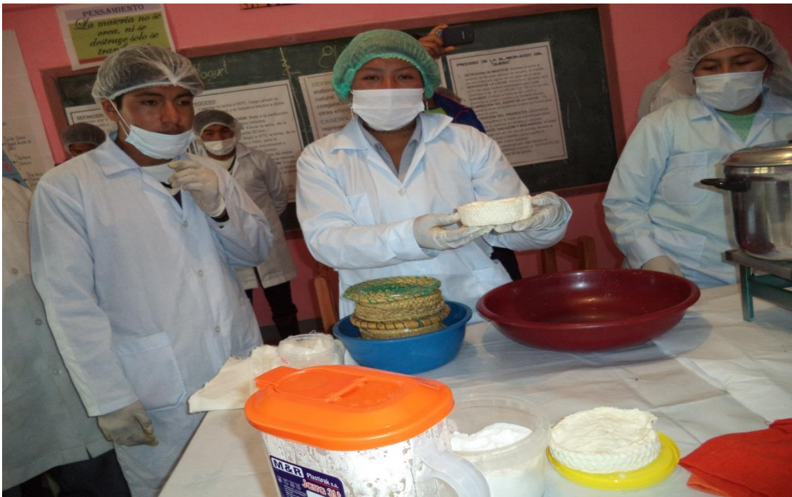
Elaboración técnica de los derivados de leche en la gestión 2014